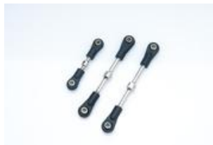
Links/ Rechts Gewinde- Spurstangen vorne und hinten