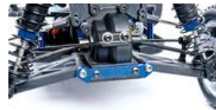
Blau eloxierte Aluminium Schwingenhalter vorne und hinten und Motorhalter

Inklusive leichtverständlicher und ausführlicher Anleitung mit hilfreichen Tipps für Anfänger.